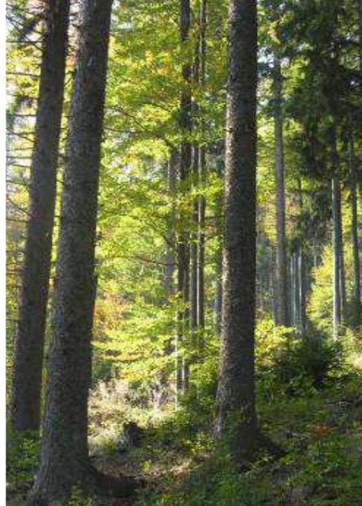
Forêts feuillues et résineuses gérées depuis plusieurs décennies selon les principes de Pro Silva, en Allemagne, Autriche et Slovaquie. Certaines sont d'anciennes plantations.